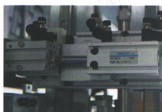
气立可气缸&感应器