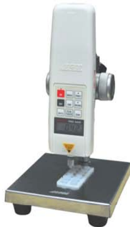
HF-2S & JSV-100N