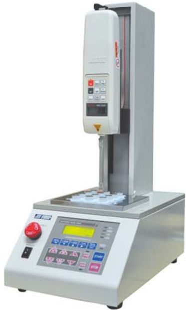
JSV-H1000 & HF-2S