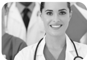
医疗健康体系 认证