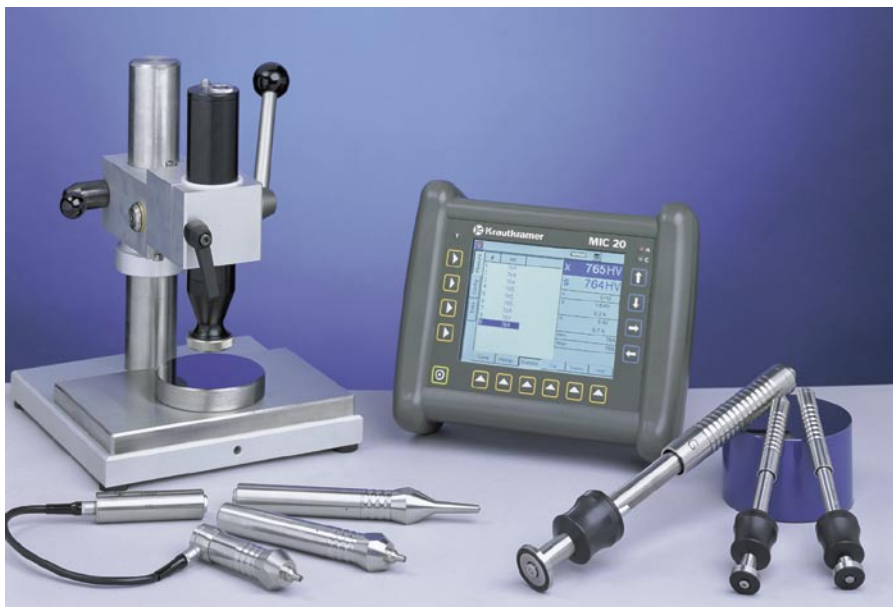
“二合一”组合式硬度计：MIC 20 能够选择使用回弹冲击设备或UCI探头，包括电动探头等。

例如，MIC 20 很容易校正。按一个按钮或“单击”相应的应用方案就可简单地将参数设置存档或调回。